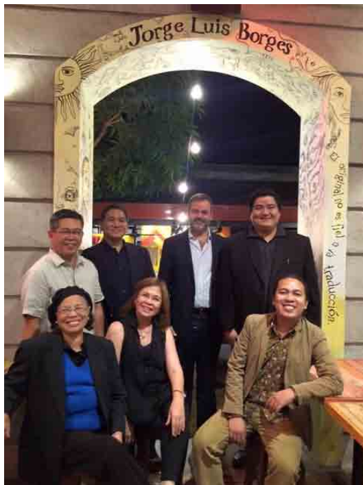
Foto del acto de presentación de la antología.

Dedicada al desarrollo de la industria editorial y la promoción del libro filipino, la BDAP, creada en 1980 organiza, también, la Feria Internacional del Libro de Manila. Está conformada por las mejores editoriales, imprentas, autores, librerías, diseñadores, exportadores y otros agentes claves de la industria. Ha establecido el Gintong Aklat en 1981.